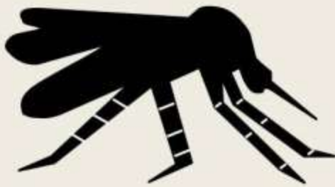
埃及斑蚊 & 白線斑蚊 Aedes aegypti Aedes albopictus