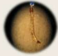
埃及斑蚊及其子 特徵：胸部背板之側緣有一對銀白色之吉他狀曲線，中間有一對狹長之黃白色直線。

登革熱 (Dengue fever) 俗稱「天狗熱」或「斷骨熱」，依據不同的血清型病毒，分為 I、II、III、IV 四種型別。如果患者感染其中一型，只會對該型免疫，仍有機會得到另外三型，以感染第 2 型最危險，易發生出血性登革熱。