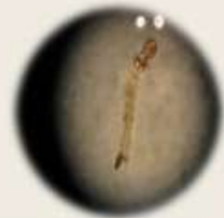
白線斑蚊及其子 特徵：胸部背板中間，僅有一條寬而直的銀白線。