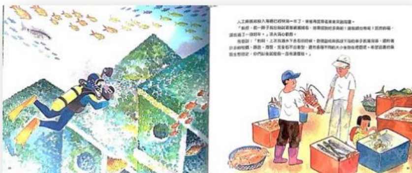
圖 3 橫式紙張創作示意圖 (1 組 = 兩頁)