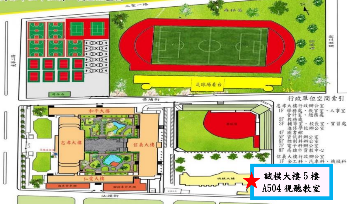
高雄市立中正高工校區配置圖