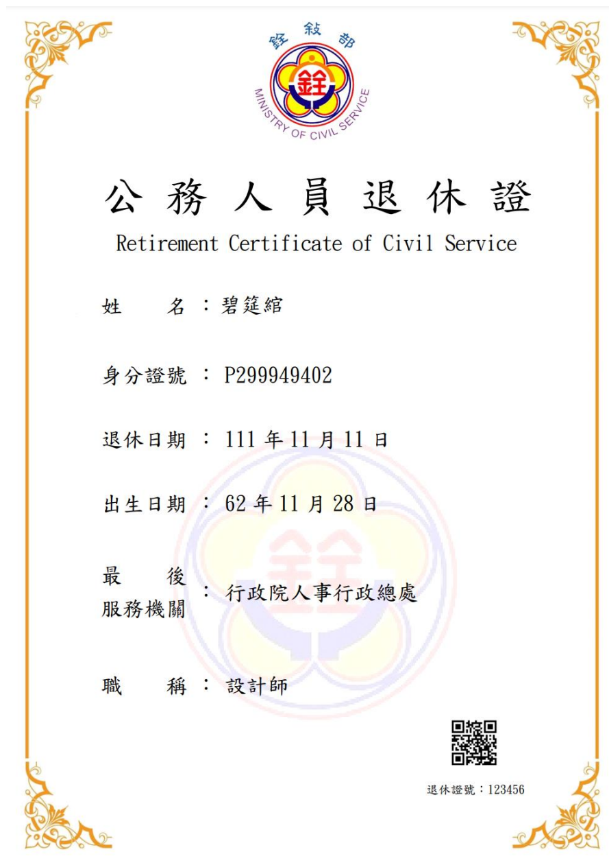
圖 8 公務人員退休證測試圖樣(範例)