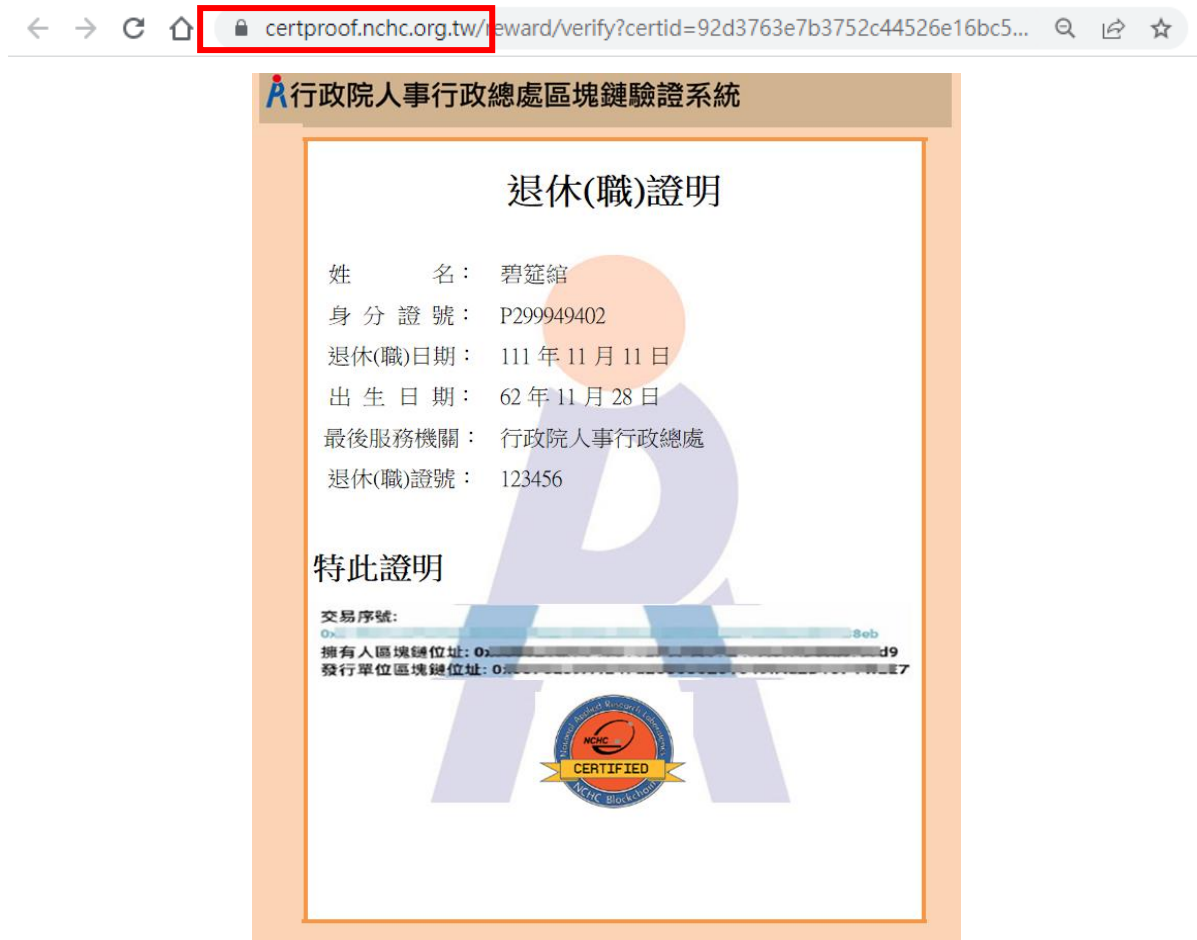
圖 10 區塊鏈驗證測試圖樣(範例)

三、 有關 MyData 系統操作問題，可利用「人事服務網 eCPA」( https://ecpa.dgpa.gov.tw/ )點選「B6:PICS 人事資訊系統客服網(含掛號室)」或電洽客服專線(02)2397-9108。