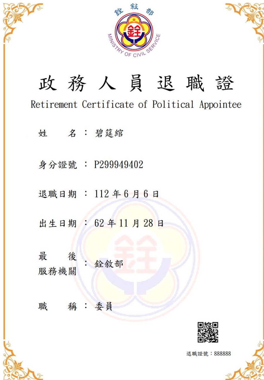
圖 9 政務人員退職證測試圖樣(範例)