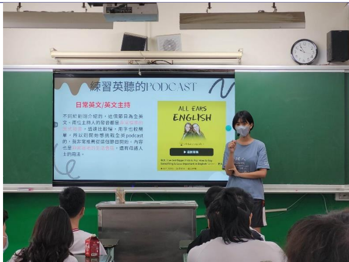
說明：學姊分享實用 podcast，供學弟妹休閒和學習兼顧。