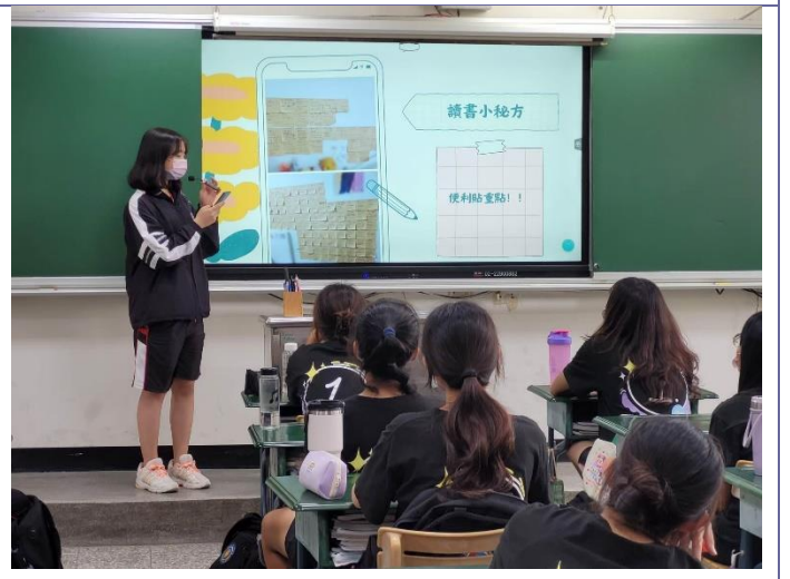
說明：校排一學姊說明考前讀書計畫與讀書技巧。