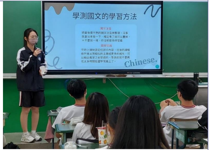
說明：學姊整理學測國文應考技巧與學弟妹分享，學弟妹聽得專心。