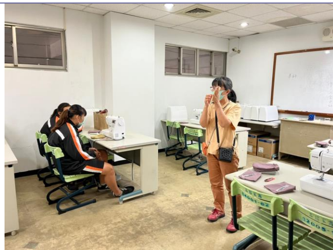
說明：廣設科實作—彈簧夾手機提袋(縫紉機操作介紹)