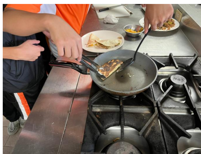
說明：餐管科實作—起司燻雞墨西哥餅(煎鍋操作)