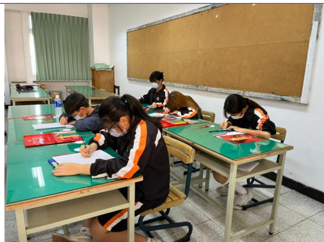
說明：幼保科實作—創意繪本製作(繪製設計概念說明)