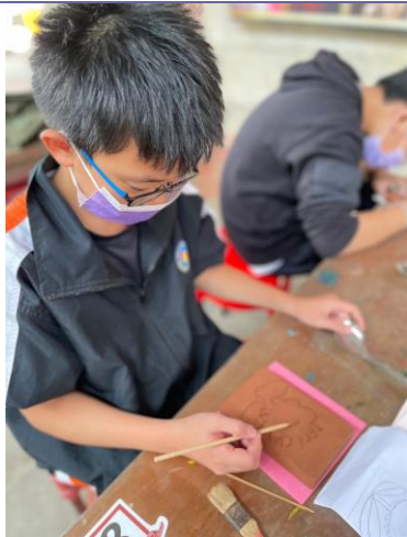
說明：學生磚雕構思。