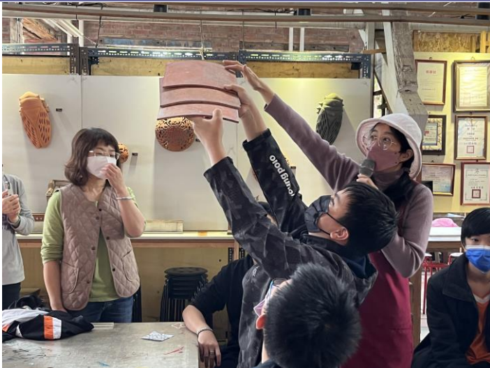
說明：瓦窯建築體驗。