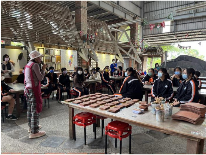
說明：磚窯產業發展介紹。