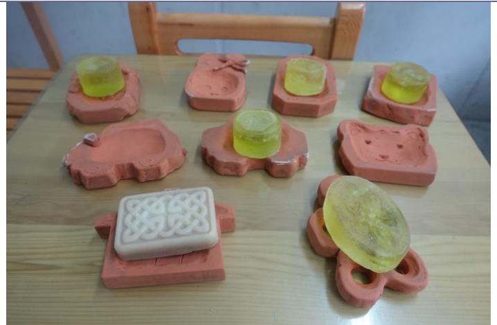
說明：學生作品展示。