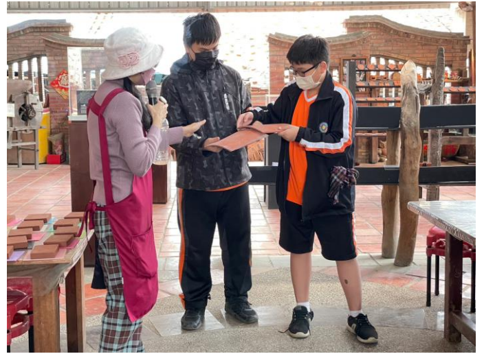
說明：磚窯於建築構造設計工法說明。