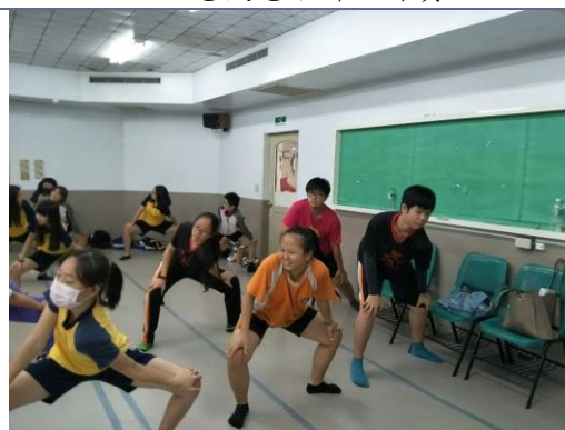
說明：藝術群上課實況