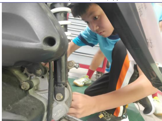
說明：動力機械群上課實況