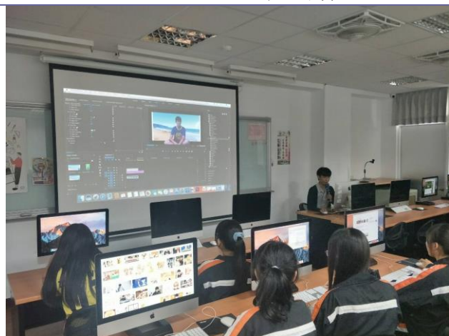
說明：設計群上課實況