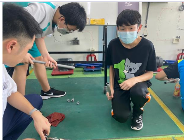
說明：電機電子群上課實況