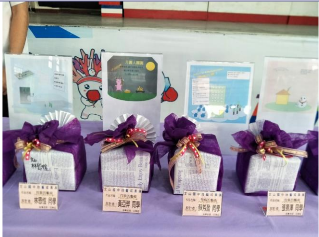
說明：商業經營群學生成果