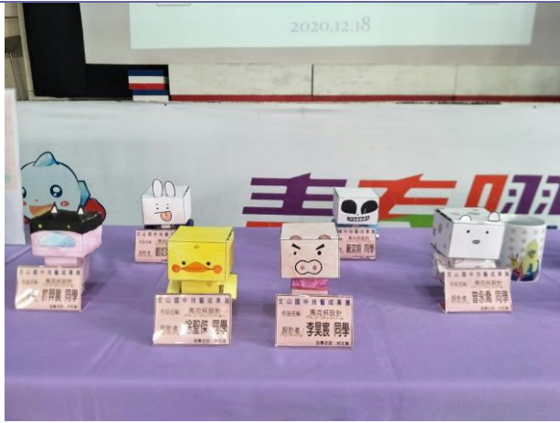
說明：設計群學生成果