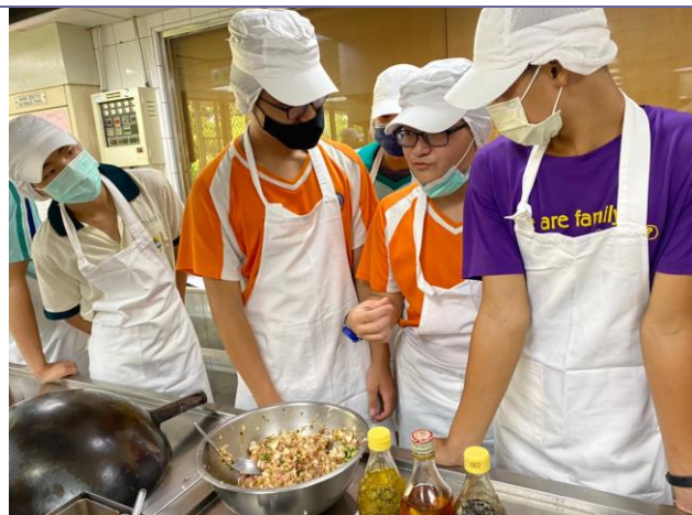
說明：食品群上課實況