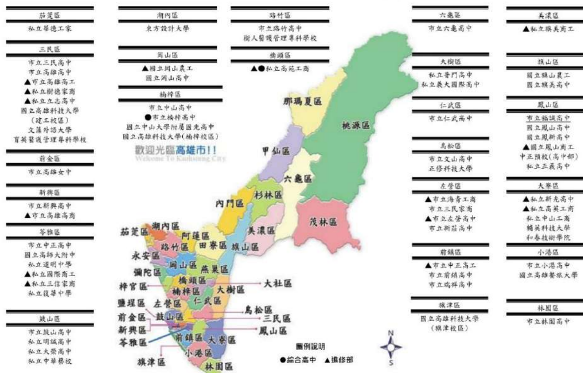
高雄區高中職、五專學校對照圖表