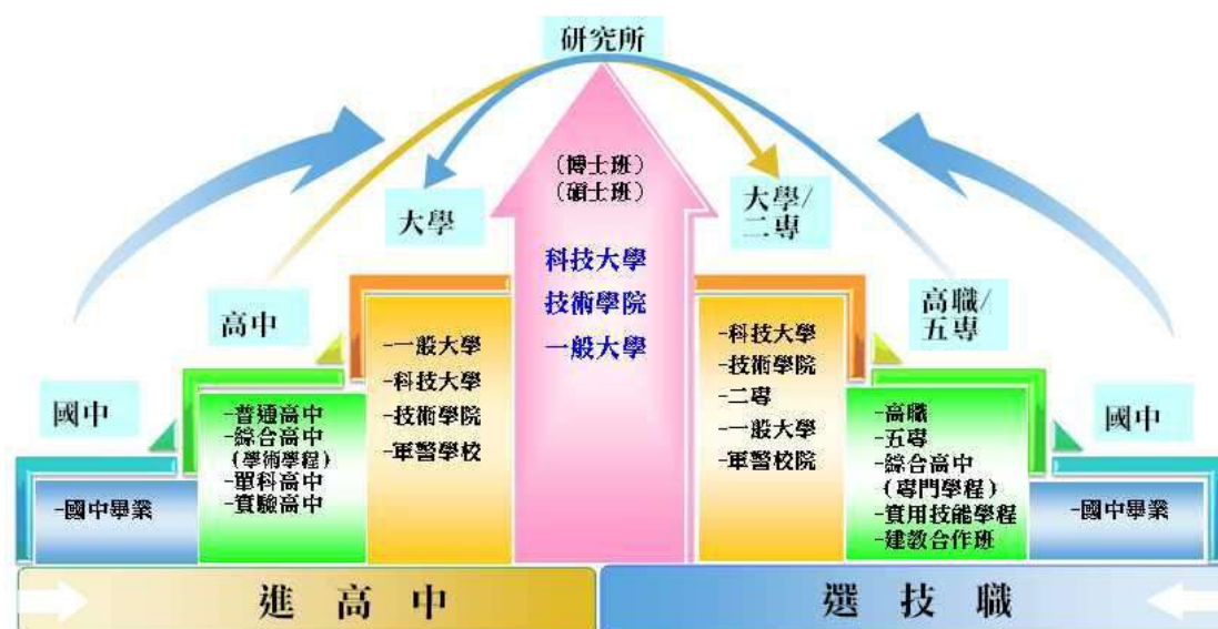
國中畢業生升學進路階梯圖